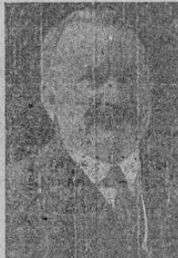
GASTON DOUMERGUE Presidente de Francia