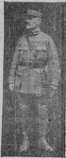
Mariscal FERDINAND FOCH El simbolo del militarismo francés

A B C con esta ocasión saluda desde sus columnas al pueblo francés en la persona de su Encargado de Negocios Sr. Deffin y a la muy honorable colonia francesa radicada en Costa Rica.