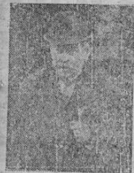
ARISTIDES BRIAND Ministro de Relaciones Exteriores