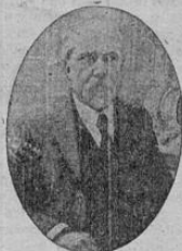
RAYMOND POINCARE El más sereno de los políticos franceses, ex-presidente de Francia